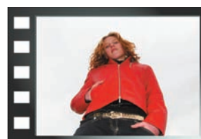
Contre plongée verticale